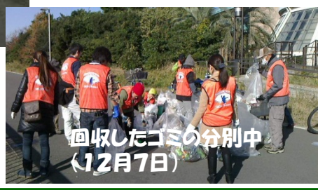
回収したゴミの分別中 (12月7日)

末広地区緑のまちづくり協議会では8月から毎月一回の清掃活動を行っています。ファンクラブは地域の企業とともに毎月参加しました。