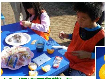
トンボみちで収穫したみかんをいただきました