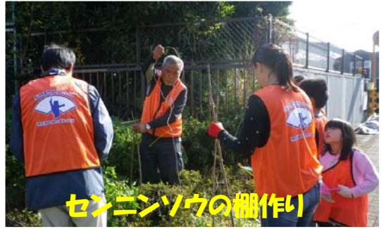
センニンソウの柵作り