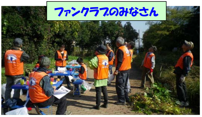
ファンクラブのみなさん