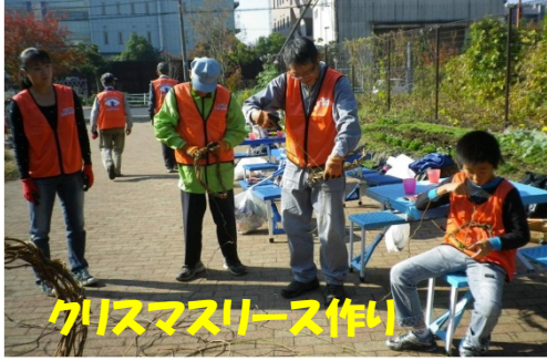
クリスマスリース作り