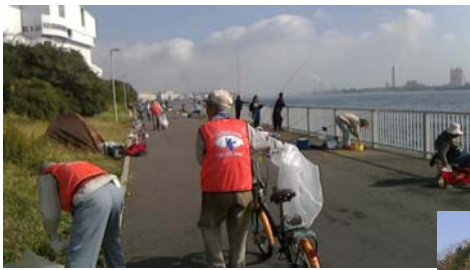
← 長いフロムナードを自転車で清掃 (11月2日)