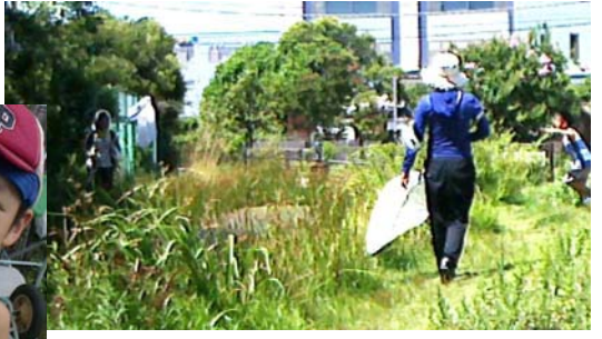
← 捕獲されたシオカラトンボ。手伝ってくれたファンクラブのお子さんが捕まえました。