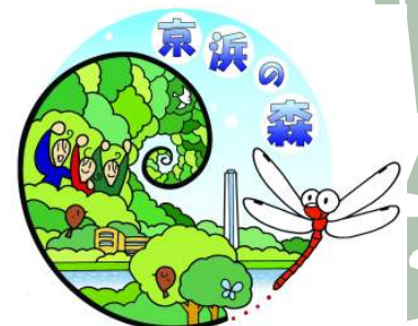
京浜の森ロゴマーク

トンボ池で 捕獲された生きもの ギンヤンマ・シオカラトンボ・ショウジョウトンボ・イトトンボのヤゴと、メダカ・ムツゴ・スジエビ、そしてヒキガエルの赤ちゃん など