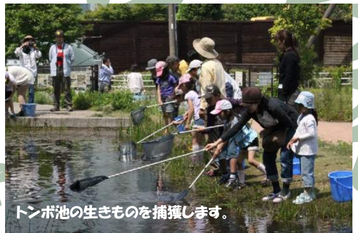
トンボ池の生きものを捕獲します。