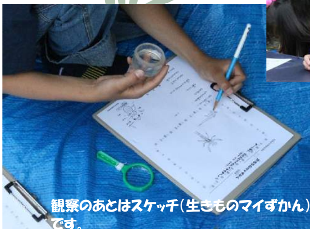
観察のあとはスケッチ(生きものマイずかん)です。

トンボ池で 捕獲された生きもの ギンヤンマ・シオカラトンボ・ショウジョウトンボ・イトトンボのヤゴと、メダカ・ムツゴ・スジエビ、そしてヒキガエルの赤ちゃん など