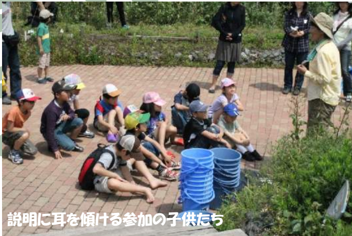
説明に耳を傾ける参加の子供たち

※開催の様子は JFE エンジニアリングホームページ「ニュースリリース」に紹介されていますのでご覧下さい URL: http://www.jfe-eng.co.jp/release/