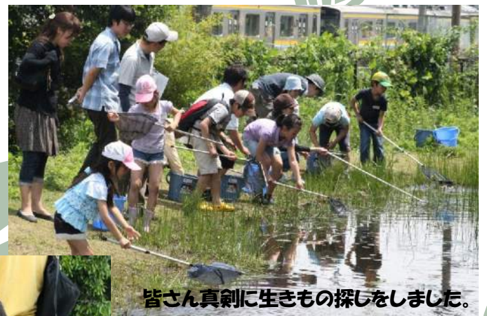
皆さん真剣に生きもの探しをしました。