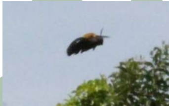
クマバチ(キムネクマバチ)