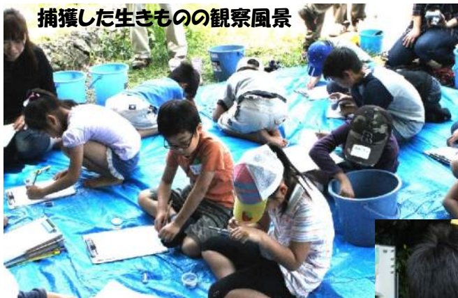
捕獲した生きものの観察風景