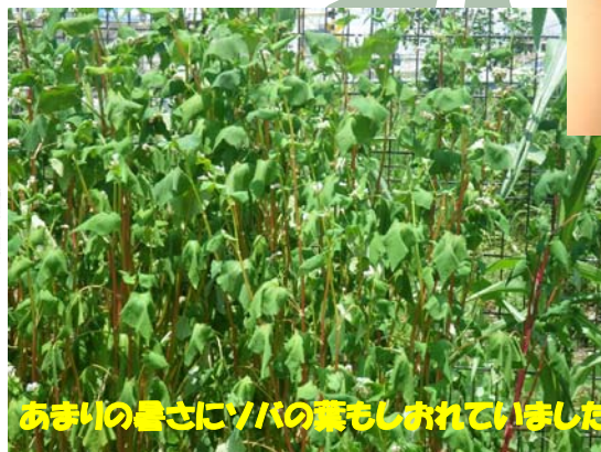
あまの豊さにソバの葉もしおれていました