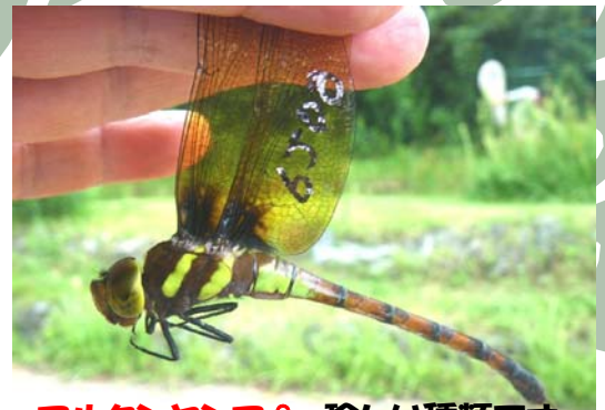
マルタンヤンマ♀ 珍しい種類です