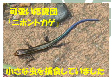
可愛い応援団 「ニホシカゲ」