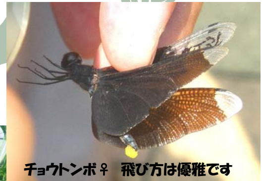
チョウトンボ♀ 飛び方は優雅です