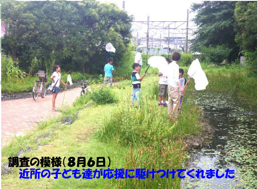
調査の様相(8月6日) 近所の子供も達が応援に駆けつけてくれました

今後、専門家による今年の調査のまとめが行なわれますが、今回の調査結果がJFEトンボみちの自然の豊かさの証となることが期待されます。