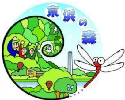
京浜の森ロゴマーク