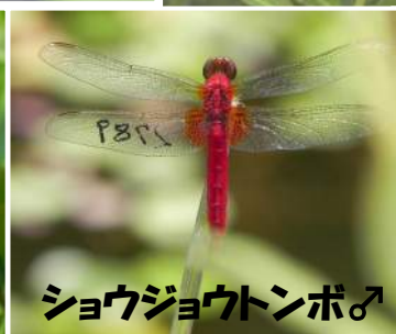
ショウジョウトンボ♂