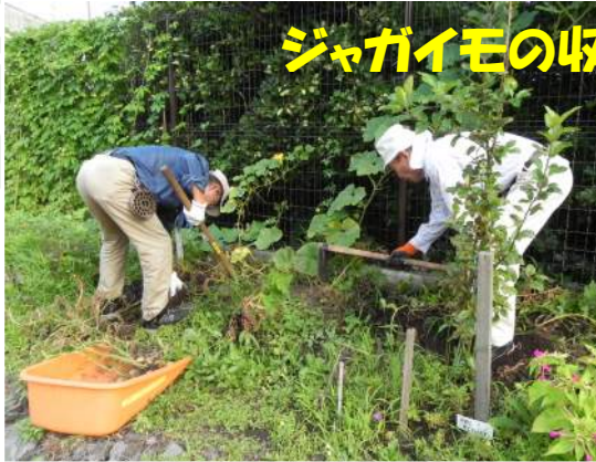
ジャガイモの収穫