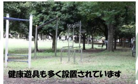
健康遊具も多く設置されています