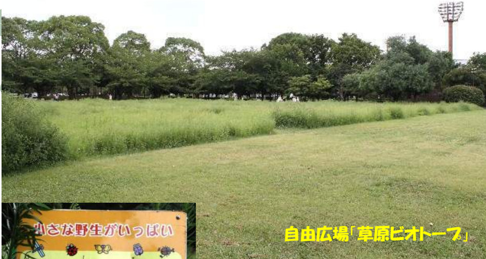
自由広場「草原ビオトープ」

中でも自由広場は一部の草を刈り残し、 草原ビオトープ として昆虫の生息地、野鳥の餌場として生物多様性の役割を担っています。公園の管理は、市指定管理者の(株)日産クエイティブサービスさんです。(記：相馬)