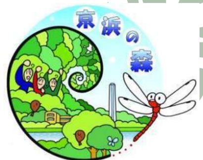
京浜の森 ロゴマーク