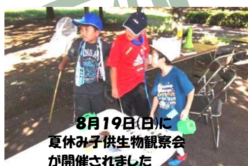
8月19日(日)に 夏休み子供生物観察会 が開催されました