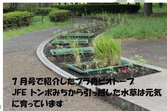
7月号で紹介したフラ舟ビオトープ JFE トンボみちから引っ越した水草は元気に育っています