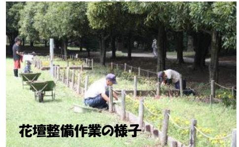
花壇整備作業の様子