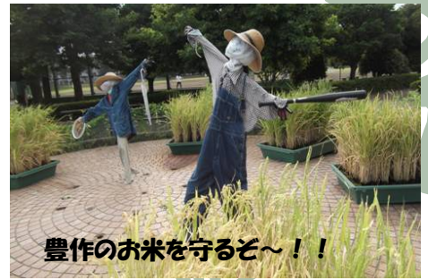
豊作のお米を守るぞ〜！！