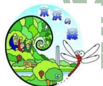
京浜の森 ロゴマーク

猛禽類の/スリが長時間頭上を旋回。餌となる小動物が棲む自然の豊かさが伺われます。