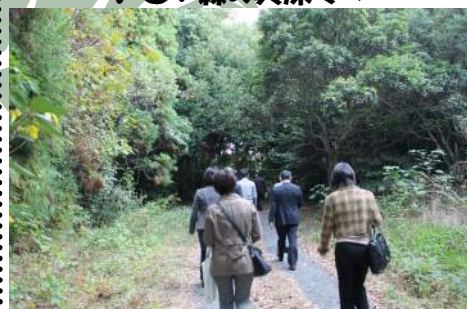
JX 日鉱日石エネルギー(株)知多製造所 いざ! 森の奥深くへ 湿地をビオトープ化(管理は有志学生)