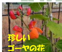
珍しい ゴーヤの花