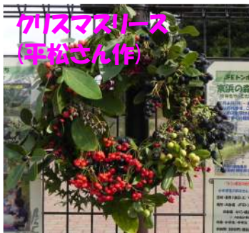
ガズマズリース (平松さん作)