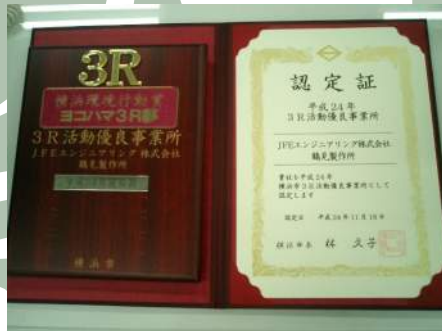
「3R 活動優良事業所」の盾(左)と認定証(右)

JFE エンジニアリング(株)鶴見製作所は、この度、横浜市「3R 活動優良事業所」に認定されました。JFE トンボみちの地域貢献活動や廃棄物の分別排出等の3R活動への取組みが高く評価されたものです。注) 3R活動: 発生抑制、再使用、再生利用