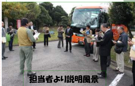
担当者より説明風景