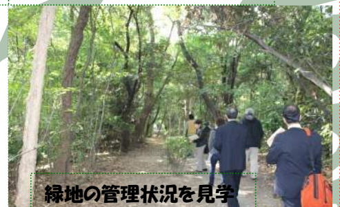
緑地の管理状況を見学