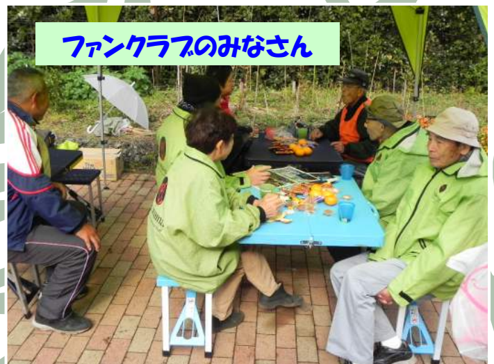
ファンクラブのみなさん

これからの活動予定です。雨天は1週間延期 今月: 12月22日(土) 10時~12時 来月: 1月26日(土) 10時~12時 事前の申込みはいりません。誰でも参加可能。