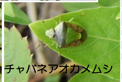
チャバネアオカメムシ

これからの活動予定です。雨天は1週間延期 今月：8月27日(土) 7時~9時 来月：9月24日(土) 8時~10時 事前申し込み不要、だれでも自由参加