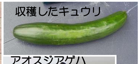
収穫したキュウリ