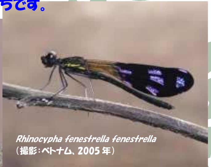
Rhinocypha fenestrella fenestrella (撮影:ベトナム、2005年)