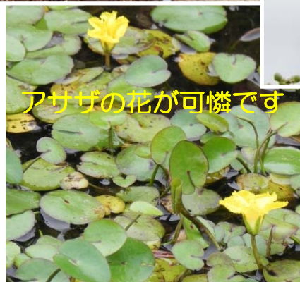
アサゲの花が可憐です