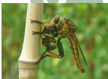
左上：カナヘビ 左下：食事中的アオメアブ 上：チョウトンボ(8月9日捕獲) 右：早くもヒガンバナが咲きました