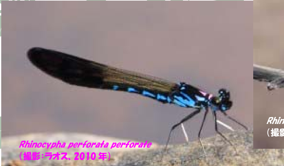
Rhinocypha perforata perforate (撮影:ラオス、2010年)