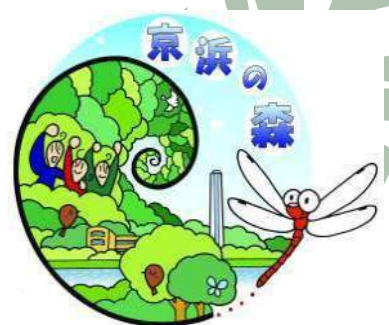
京浜の森ロゴマーク