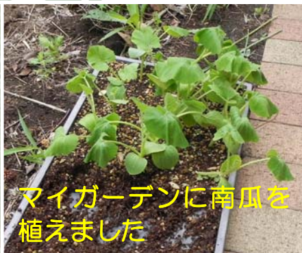
マイガーデンに南瓜を 植えました