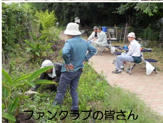
ファンクラブの皆さん