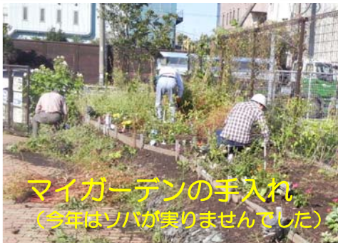
マイガーデンの手入れ (今年はソバが実りませんでした)