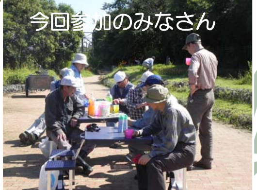
今回参加のみなさん