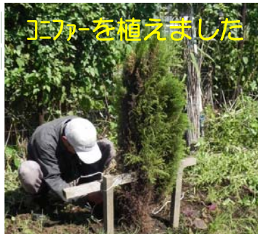
エコーを植えました