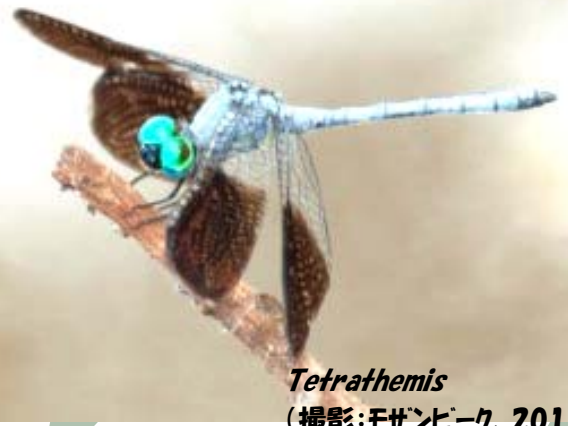
Tetrathemis (撮影:モザンビーク、2011年)