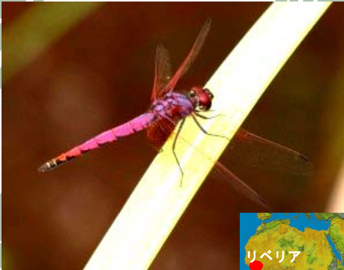
Trithemis kalula (撮影:リベリア、2010年)