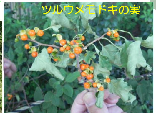
ツルウメモドキの実