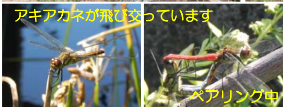
アキアカネが飛び交っています