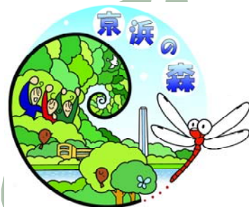
京浜の森ロゴマーク

トンボは、生きている小動物を捕らえて食べる肉食主義者です。ハエ、カ、フヨ、カなど様々ですが、天敵であるクモを好んで食べるトンボもいます。また、トンボ同士で大型の種類が小型の種類を食べることもあるそうです。