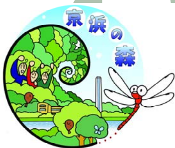
京浜の森ロゴマーク