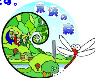
京浜の森ロゴマーク

ラストを務める私はノシメトンボ♀です。体長は、4.5cmと小型です。北海道から九州まで広く分布し、丘陵地の池沼で会えるよ。最盛期は7月から10月です。