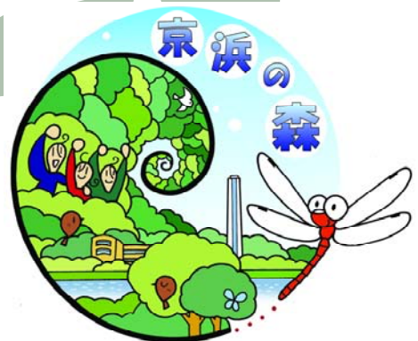
京浜の森ロゴマーク