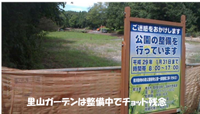
里山ガーデンは整備中でちょっと残念

さて、肝心の里山ガーデンですが、ズーラシアの森という谷戸を含む原生林の中に、アスレチックゾーン、大花壇ゾーン、花菖蒲ゾーン、生物多様性ゾーンなどを設ける予定とのことでした。訪れた日は、まだいずれも工事中で、その様子を遠目に眺められました。出来上がったらまた行ってみましょう。(^^)/(銀)