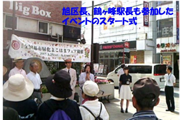
旭区長、鶴ヶ峰駅長も参加したイベントのスタート式

旭区民と区役所職員の参加者約30人が、朝9時半にスタートして、途中の名所旧跡などを訪れながら、約3時間かけてズーラシアを目指しました。熱中症が心配される天候のなか、参加者は12時30分に時間通りゴールに到着できました。