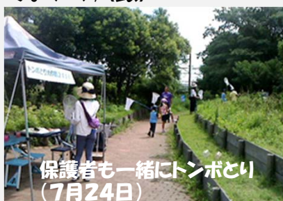
保護者も一緒にトンボとい (7月24日)