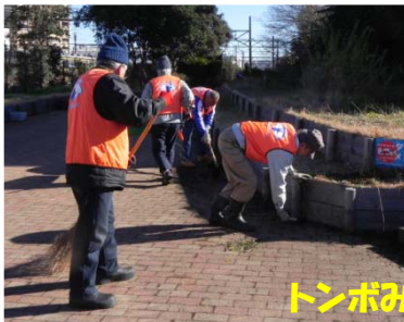
トンボみちの手入れ