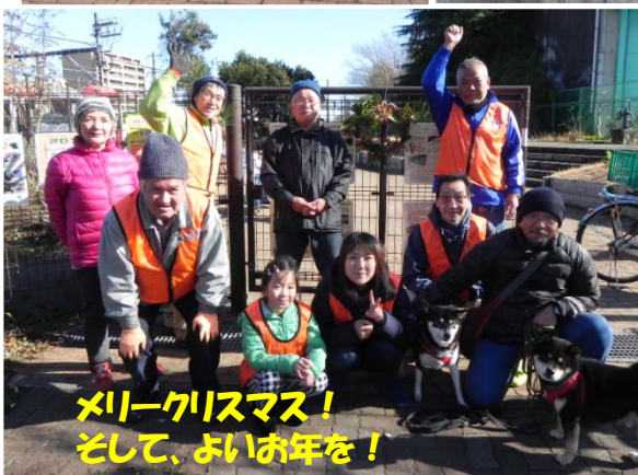
メリークリスマス！ そして、よいお年を！