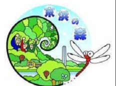
京浜の森ロゴマーク

※「JFEトンボみち」はJFEエンジニアリング(株)が地域の皆様に開放している公開緑地です