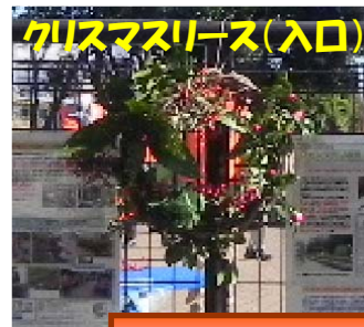
クリスマスリース(入口)