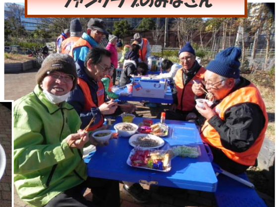
ファンクラブのみなさん

活動予定 ※雨天は1週間延期 今月：1月28日(土) 9時～11時 来月：2月25日(土) 9時～11時 事前の申込みは不要です。誰でも参加可能！ 公式ホームページをご覧ください