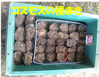
コスモスの種まき