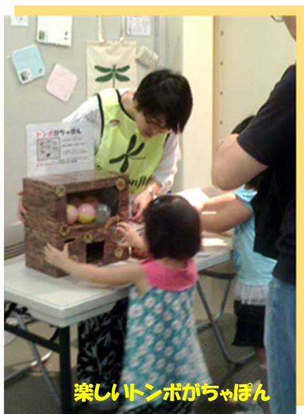
楽しいトンボがちゃぼん

トンボやいきものへの興味は、それらが生息する自然環境への関心に繋がってゆくはずで、子どもたちはやがてそれらに悪影響を与えている人間の行動に疑問を抱いてくれることでしょう。