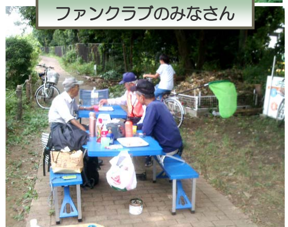
ファンクラブのみなさん

活動予定 ※雨天は1週間延期 今月: 9月28日(土) 9時~11時 来月: 10月26日(土) 9時~11時 事前の申込みは不要です。誰でも参加可能! 公式ホームページをご覧ください