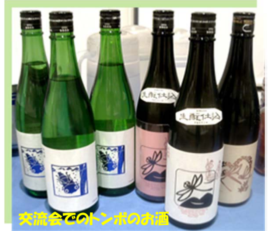
交流会でのトンボのお酒

解決の糸口を見つけてくれるかもしれません。そんな期待を抱かせてくれた今回のサミットでした。来年は愛知県豊田市が会場です。ぜひ行ってみたいと思います。(銀)