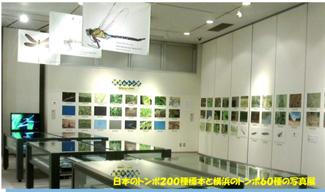
日本のトンボ200種標本と横浜のトンボ60種の写真展