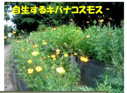
自生するキバナコスモス