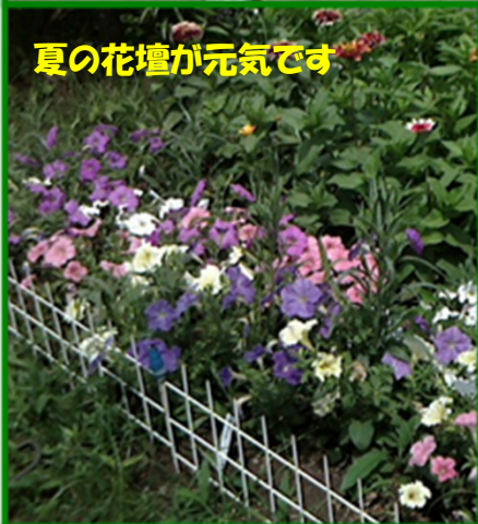
夏の花壇が元気です