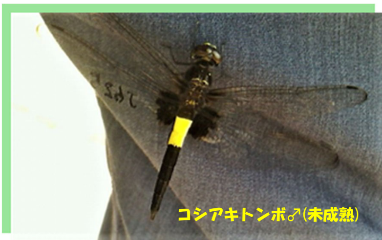
コシアキトンボ♂(未成熟)