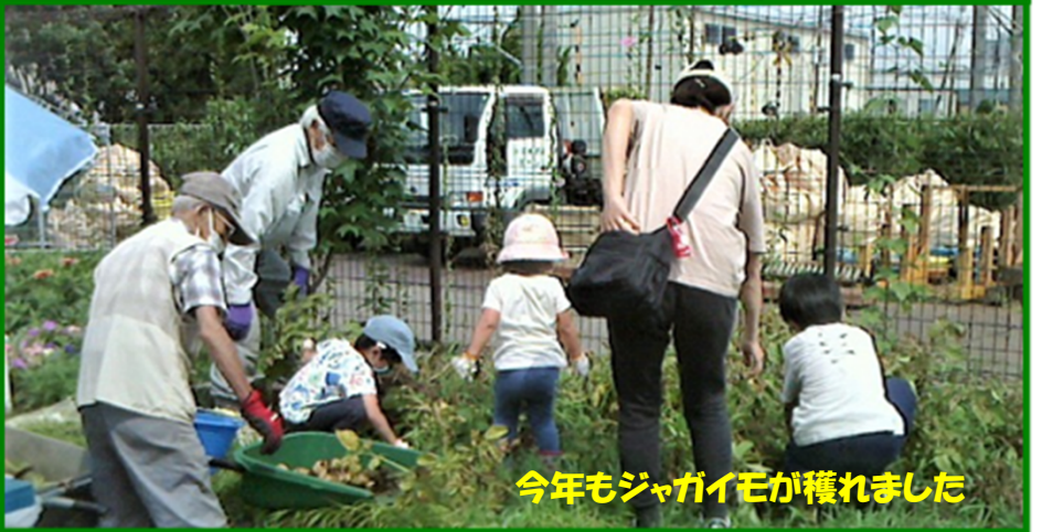
今年もジャガイモが穫れました