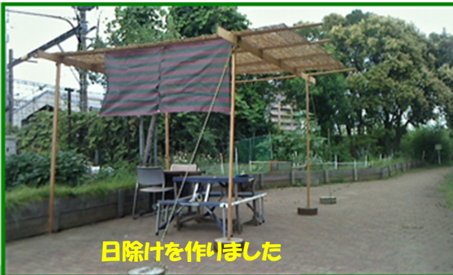
日除けを作りました