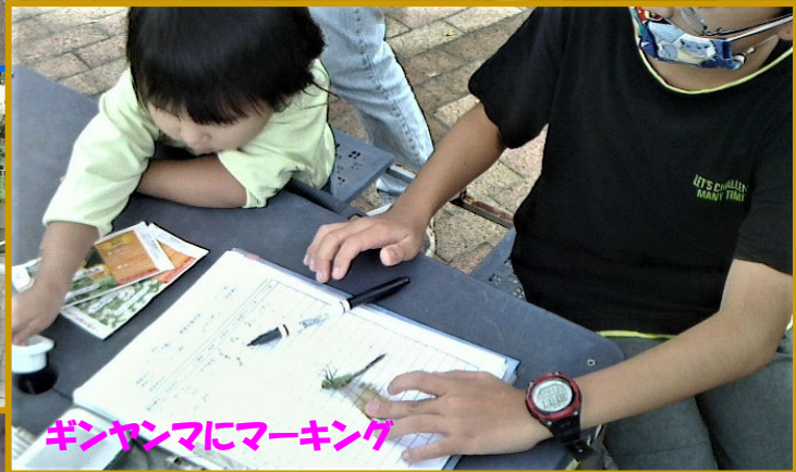
ギンヤンマにマーキング