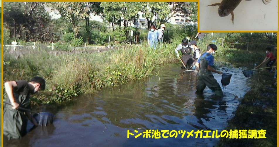
トンボ池でのツメガエルの捕獲調査

活動予定 ※雨天は1週間延期 今月: 10月23日(土) 9時~11時 来月: 11月27日(土) 9時~11時 事前の申込みは不要です。誰でも参加可能! 公式ホームページをご覧ください