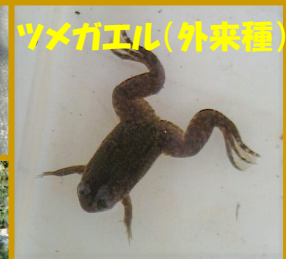
ツメガエル(外来種)