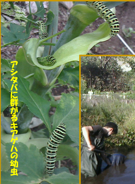
アシタバに群がるキアケハの幼虫