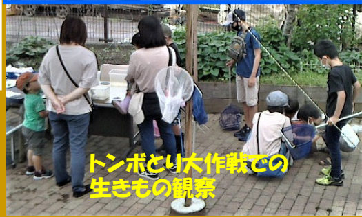
トンボとり大作戦での生きもの観察