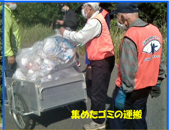
集めたゴミの運搬