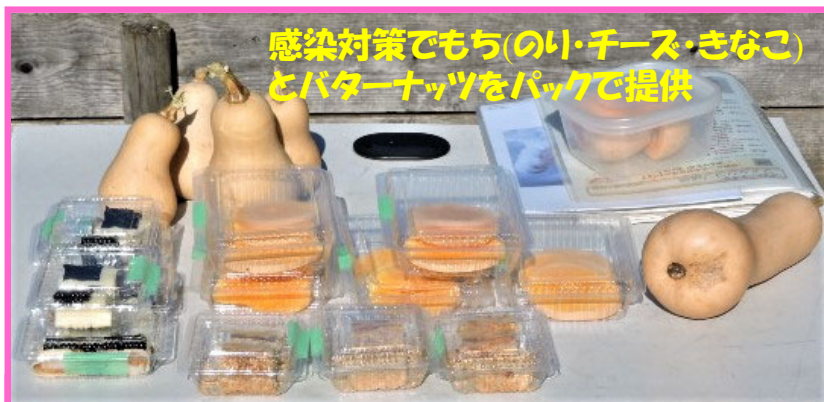
感染対策でもち(のい・チーズ・きなこ)とバターナッツをバッグで提供