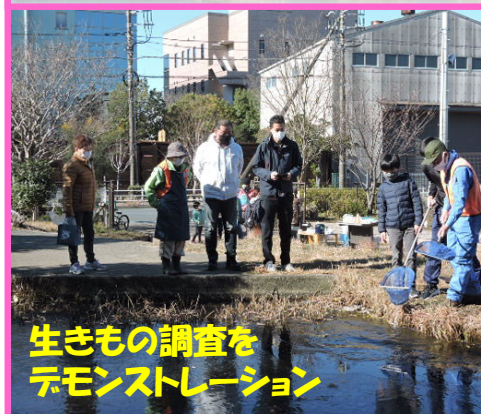
生きもの調査をデモンストレーション