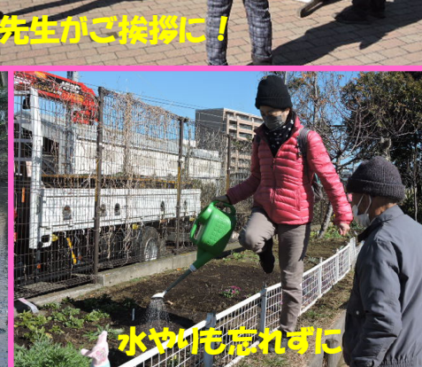
水やりも忘れずに

活動予定 ※雨天は1週間延期 今月: 2月26日(土) 中止します 来月: 3月26日(土) 9時~11時 事前の申込みは不要です。誰でも参加可能! 公式ホームページをご覧ください