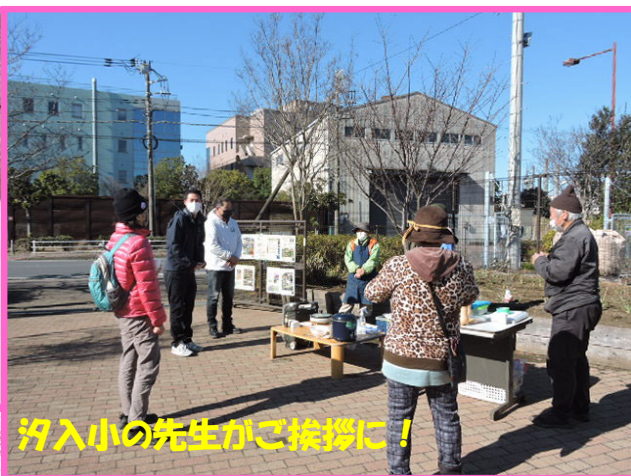
汐入小の先生がご挨拶に!