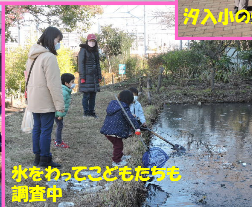
氷をわってこどもたちも調査中