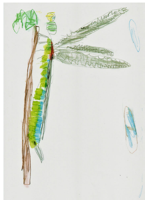
(木の枝にとまっていたとんぼ)