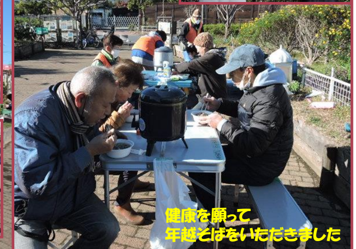
健康を願って年越しそばをいただきました