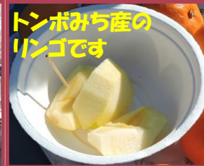
トンボみち産のリンゴです