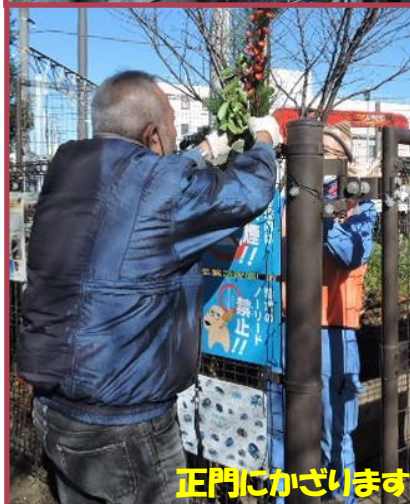
正門にかざります