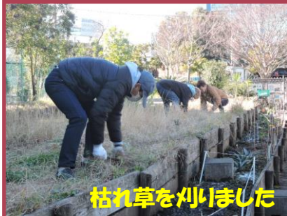
枯れ草を刈りました