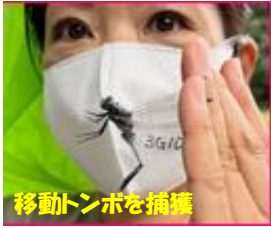
移動トンボを捕獲