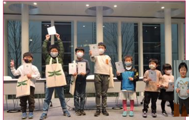
受賞したこどもたち(アトリウムにて)

参加回数によって、フォーラム大賞5名、フォーラム優秀賞4名のこどもたちが表彰されたほか、三ッ池公園のトンボとり大作戦で、高田池でマキングされた後、飛んで移動してきたシオカラ