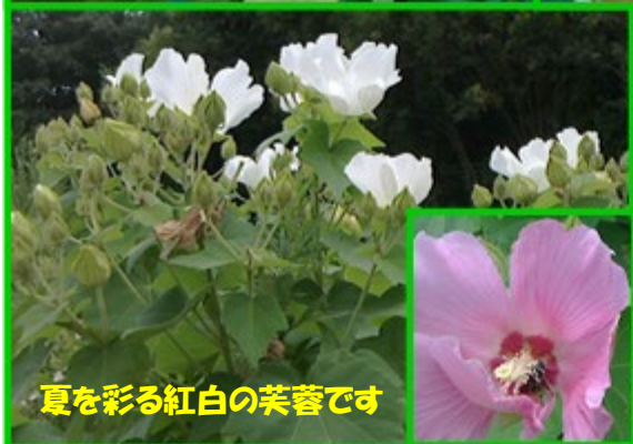
夏を彩る紅白の芙蓉です