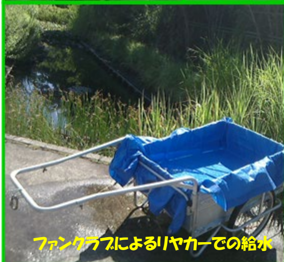
ファンクラブによるリヤカーでの給水