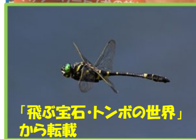
「飛ぶ宝石・トンボの世界」 から転載