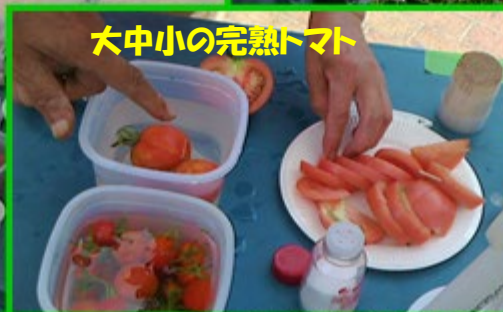
大中小の完熟トマト