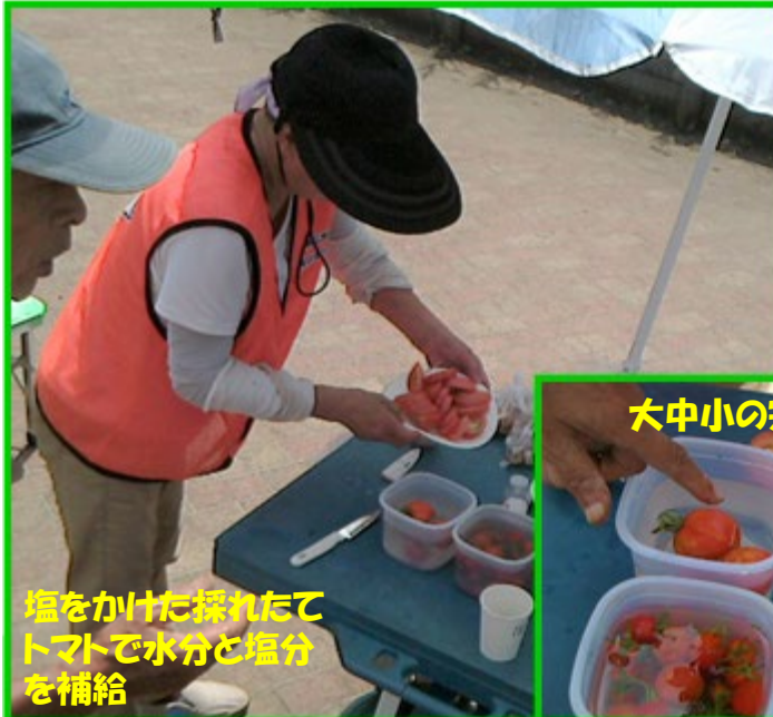
塩をかけた採れたて トマトで水分と塩分 を補給