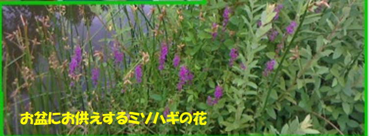
お盆にお供えするミソハギの花