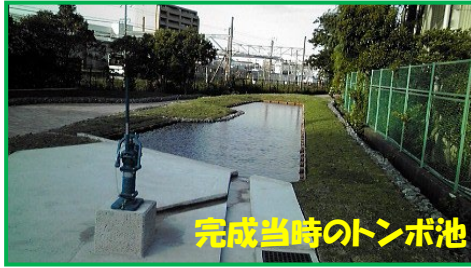
完成当時のトンボ池