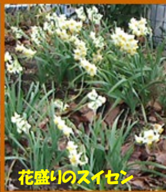
花盛りのスイセン