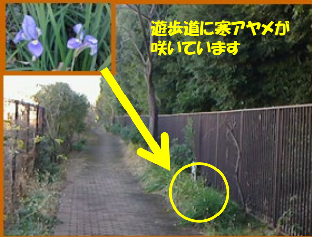
遊歩道に寒アイヤメが咲いています