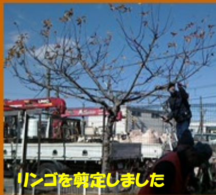
リンゴを剪定しました

最近の活動のなかから、 月例活動(1月27日) の様子をお伝えします。