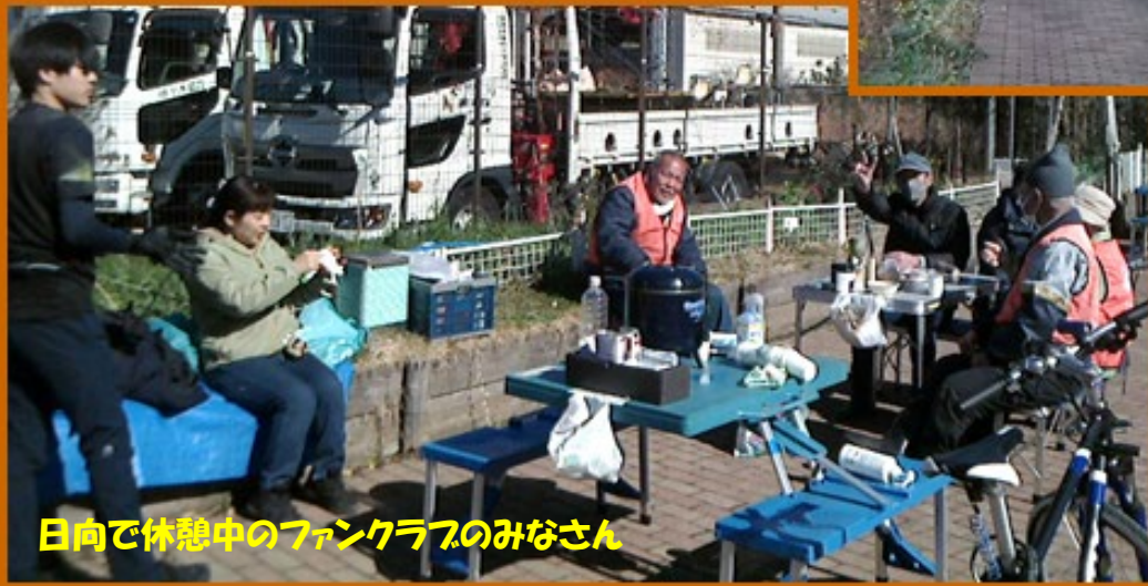
日向で休憩中のファンクラブのみなさん