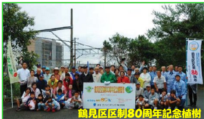
鶴見区区制80周年記念植樹