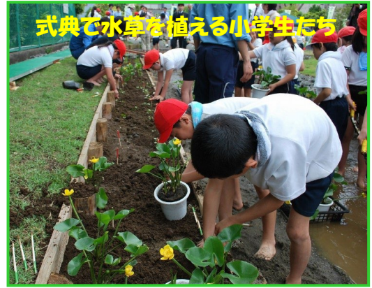
式典で水草を植える小学生たち

来月号では、 JFEトンボみち誕生後のヒストリー をお伝えする予定です。(銀( _ - ) - ☆)