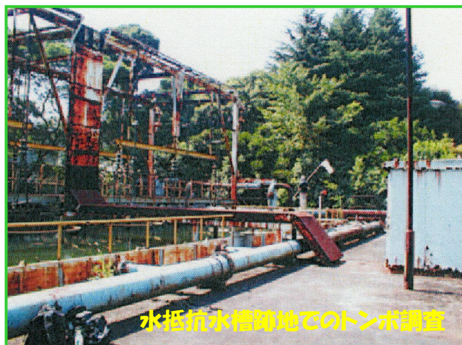
水抵抗水槽跡地でのトンボ調査

「京浜の森づくり 末広地区協働緑化宣言」が横浜市と鶴見区末広地区の企業10社と調印され、JFEは遊休地化していた駐車場跡地を活用した緑化計画をスタート。