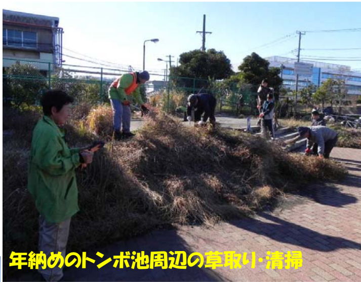
年納めのトンボ池周辺の草取り・清掃

12月28日(土)のファンクラブ活動の様子です。 2013年も無事に活動を終えることができました。