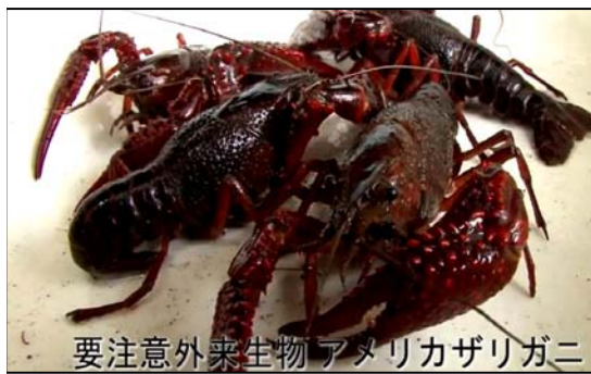
要注意外来生物 アメリカザリガニ

「かいぼり」の説明は井の頭恩賜公園(東京都武蔵野市・三鷹市)の公式ホームページから、三ッ池公園の「かいぼり」風景はYouTubeから、それぞれ転載させていただきました。(記事:柴田)