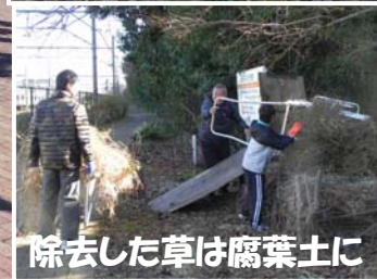
除去した草は腐葉土に