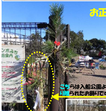
お正月のしめ縄などを飾りました