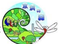
京浜の森ログマーク

発行日: 2014年 1月22日 発行者: トンボみちファンクラブ事務局 事務局: 〒230-8611 横浜市鶴見区末広町2-1 JFEエンジニアリング(株)鶴見製作所 環境保全室 Tel045-505-7447, Fax045-505-6546 ファンクラブ通信への自由投稿をお待ちしています。