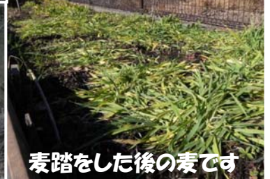
麦踏をした後の麦です